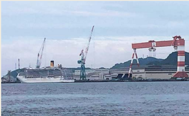
コスタ・アトランチカ号

乗員の感染者が149名にまで上ったコスタ・アトランチカ号が長崎の港を出てマニラに向かいました。