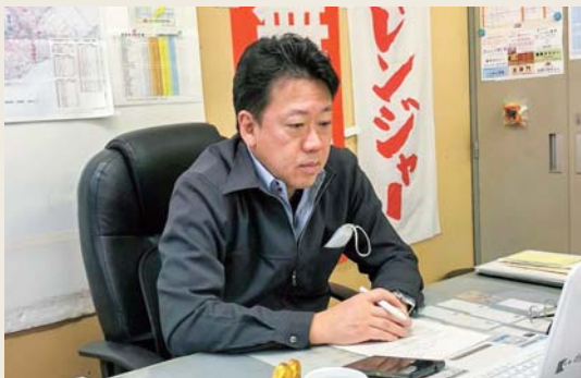
ドットJIPの学生さんたちと打ち合わせ