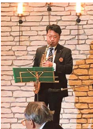
県政報告会で自慢?のアルトサックスを披露する

避難所は密になりやすいので、特に自然災害の多い地域での避難(避難所)の在り方を早急に構築しなければいけないですね。