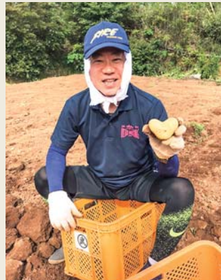
諫早市飯盛町のジャガイモ畑で

爆発的な2次感染や医療崩壊を起こさず、この日を迎えた事は、長崎の知恵と経験として永く蓄積されて行くでしょう。