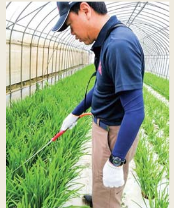
諫早市森山町のニラハウスにて