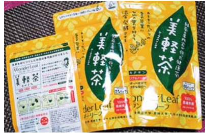
ビワの葉発酵茶ワンダーリーフ「美軽茶」