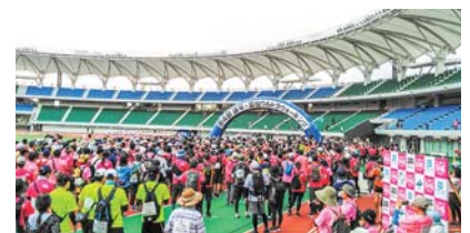
第4回諫早・雲仙ウルトラウォーキング

競技ボート場として日本代表チームや日本ボート協会から高い評価を得ている本明川下流域を公認A級コースとして整備したらどうか？