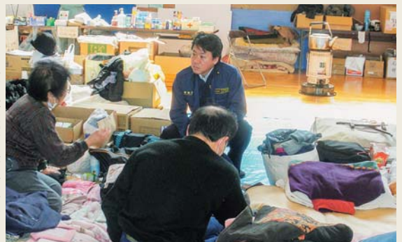
3・11東日本大震災後の福島県いわき市の避難所で

会議の相手は東京など遠方もありますが、移動なし、接触なし、飛沫なし、新しい生活様式!