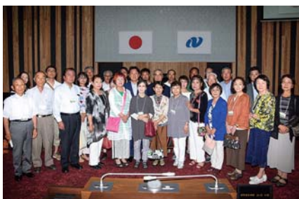
中村知事も一緒に記念撮影